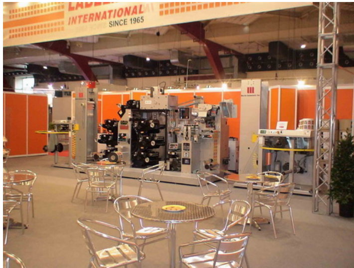
罗铁公司在欧洲标签展上的展台

罗铁公司与马汀公司成为了长期的合作伙伴，两家公司的携手合作已初见成效。在今年欧洲举办的国际标签展中，罗铁公司将其所购置的第一套马汀不停机放卷与收卷设备，与其公司的 PW260-R6C 六色印刷机共同隆重展出，设备刚一亮相，立刻吸引了许多在场观众的眼球，现场效果反应极佳，受到各方业内人士的一致好评。展会中所使用的印刷材料包含了模内标签，不干胶，薄膜与纸类等。由此，罗铁公司又于 11 月的亚洲国际标签展中，将马汀设备与其印刷机再次共同展出，展台前仍是人头攒动，好评如潮。